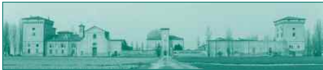
(Castello dei Ronchi)